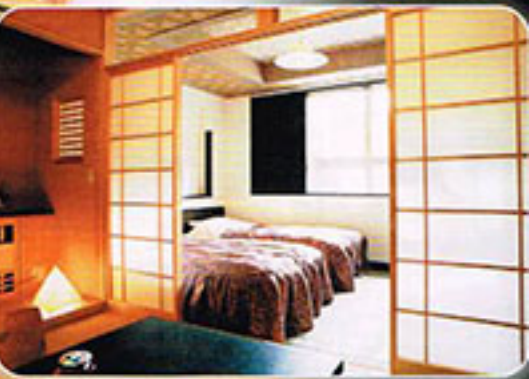
のんびりと湯っくりが一緒になったくつろぎのお部屋 (16室)