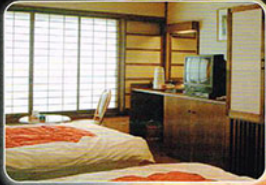
落ち着いた日本情緒。心が安らぐ古民家風客室 (15室)