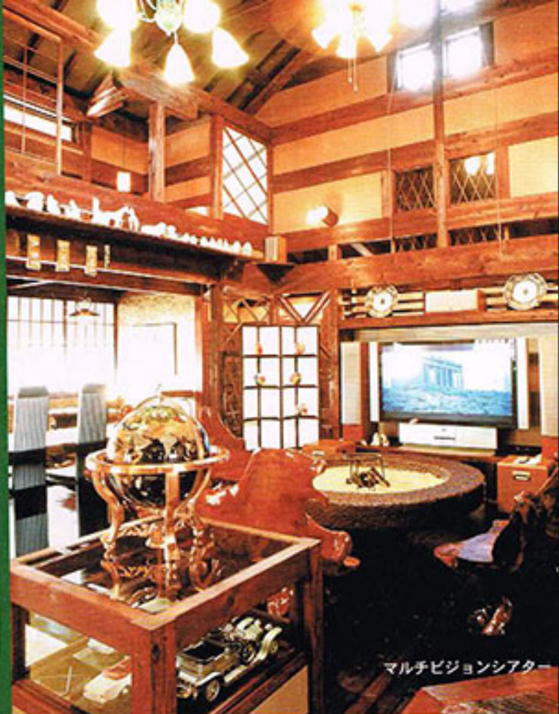
マルチビジョンシアター

明治、大正浪漫、昭和初期風に趣向を凝らしたお部屋は、過ぎ去りし昔への憧憬を感じさせます。