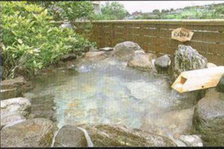
風流親月の湯(男湯)