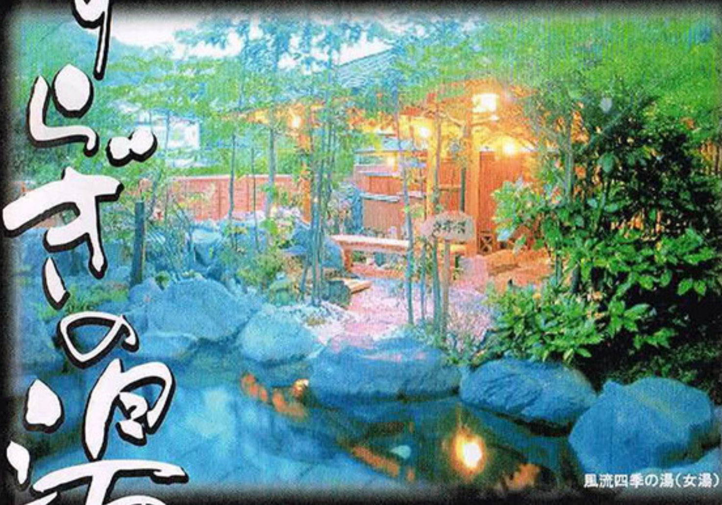
風流四季の湯(女湯)

風流やすらぎの湯は、庭園露天風呂の中に、男湯・女湯・混浴、貸切家族湯があります。大自然と一体化しながら温泉をお楽しみください。