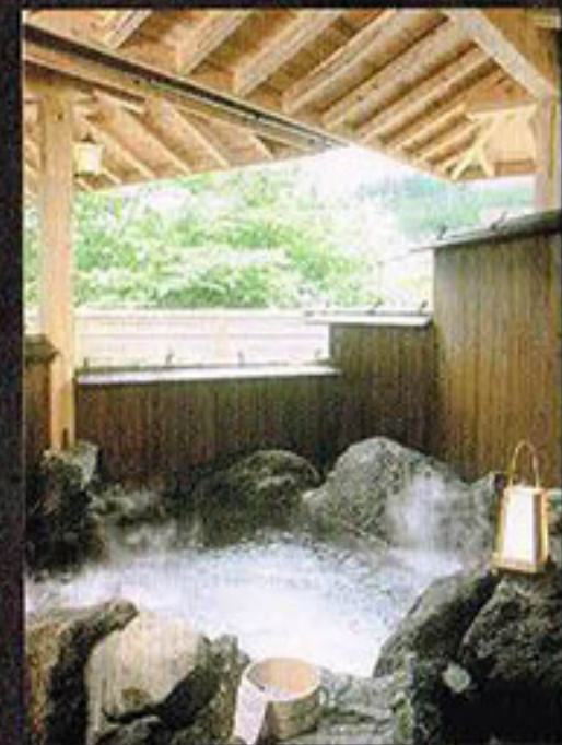
みずいらすくつろぎの湯(家族湯)

風流やすらぎの湯は、庭園露天風呂の中に、男湯・女湯・混浴、貸切家族湯があります。大自然と一体化しながら温泉をお楽しみください。